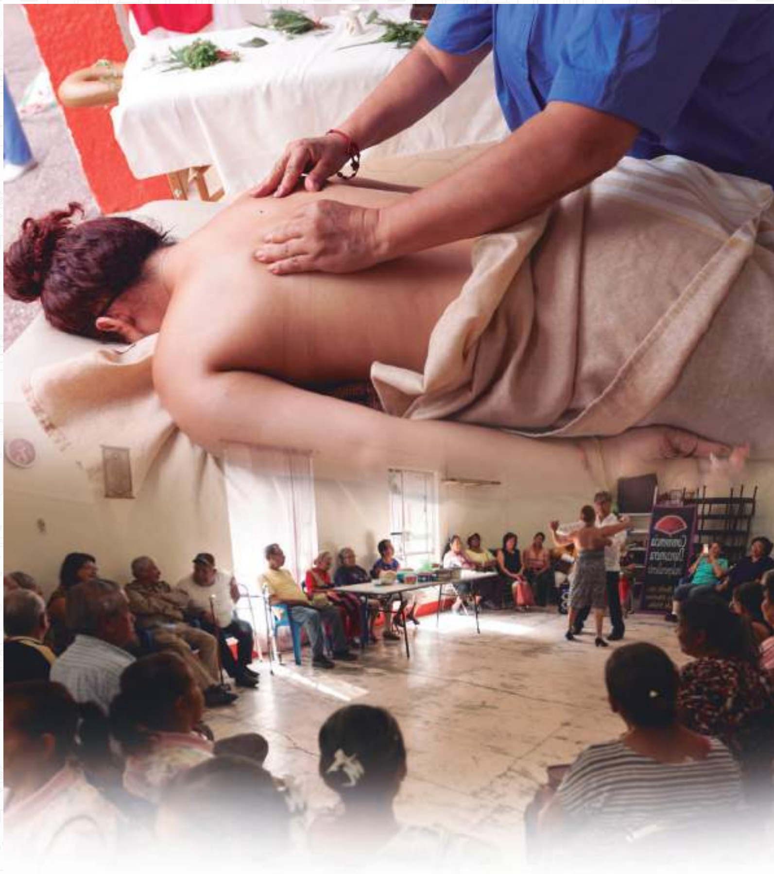
Eje Estratégico 6. Igualdad Sustantiva entre mujeres y hombres, Desarrollo Económico, Equidad Social y trabajo Digno y Decente.