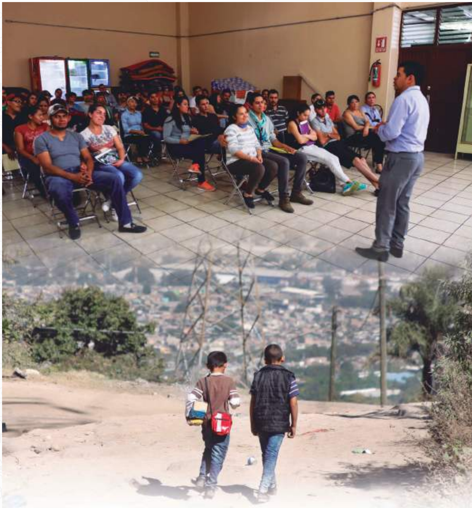
Eje Estratégico 8. Cultura de la Legalidad, el respeto a los Derechos Humanos y la Seguridad Ciudadana.