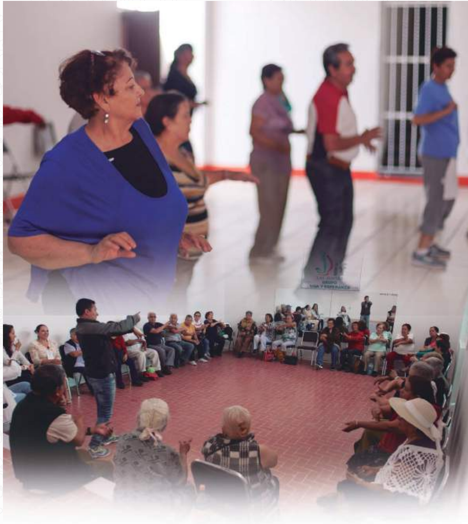
Eje Estratégico 7. Calidad de vida con las oportunidades reales de vivir, la ampliación de la Educación, el acceso a la Cultura y la cobertura de Salud.