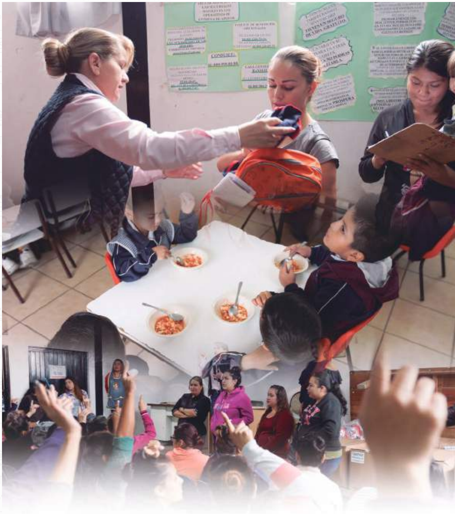
Eje Estratégico 5. Calidad de vida con las oportunidades reales de vivir, la ampliación de la Educación, el acceso a la Cultura y la cobertura de Salud.