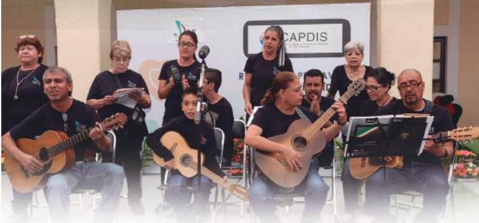
Eje Estratégico 3. Calidad de vida con las oportunidades reales de vivir, la ampliación de la Educación, el acceso a la Cultura y la cobertura de Salud.