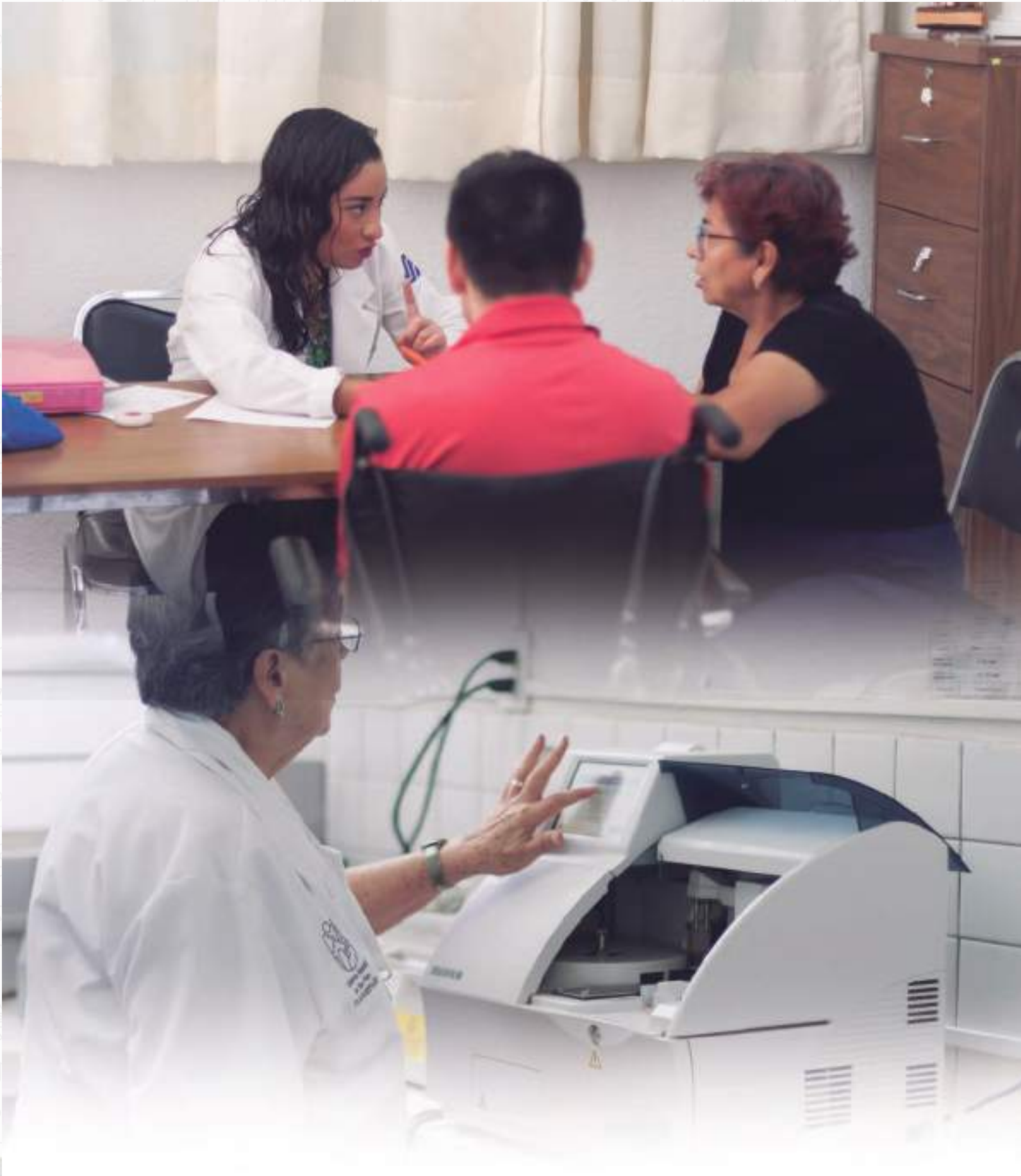
Eje Estratégico 2. Calidad de vida con las oportunidades reales de vivir, la ampliación de la Educación, el acceso a la Cultura y la cobertura de Salud.