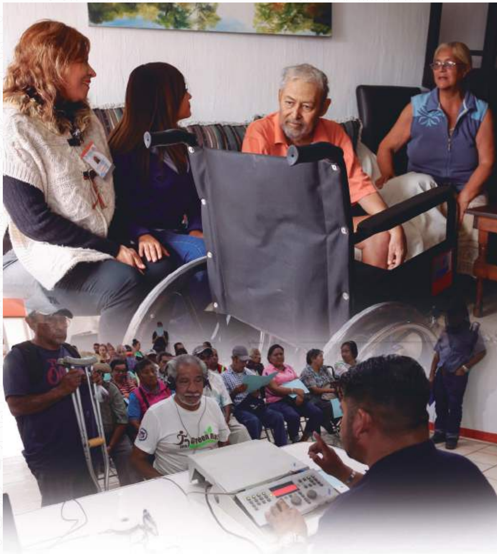
Eje Estratégico 4. Calidad de vida con las oportunidades reales de vivir, la ampliación de la Educación, el acceso a la Cultura y la cobertura de Salud.